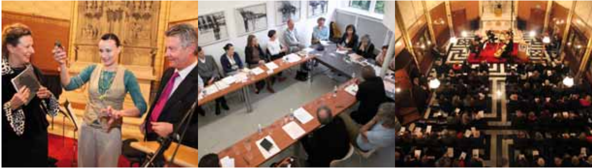
Evens Prijs voor Visuele Kunst 2009