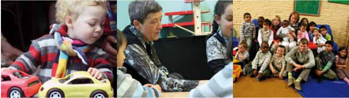
Spelotheken / Prinses Mathilde van België op bezoek bij Walala/Walalou