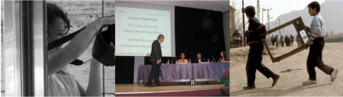
Evens Prijs voor Media-educatie 2009