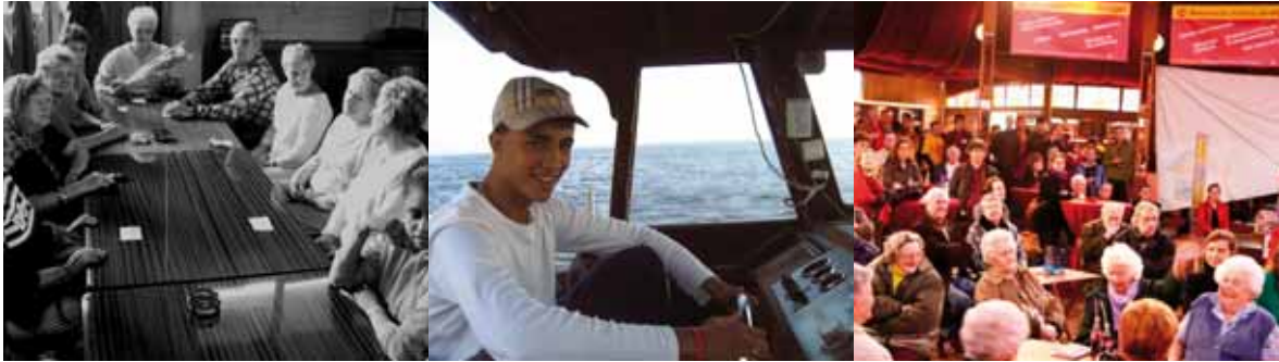
Van links naar rechts: Buurtschatten - Hoger Wal! - Noorderlicht